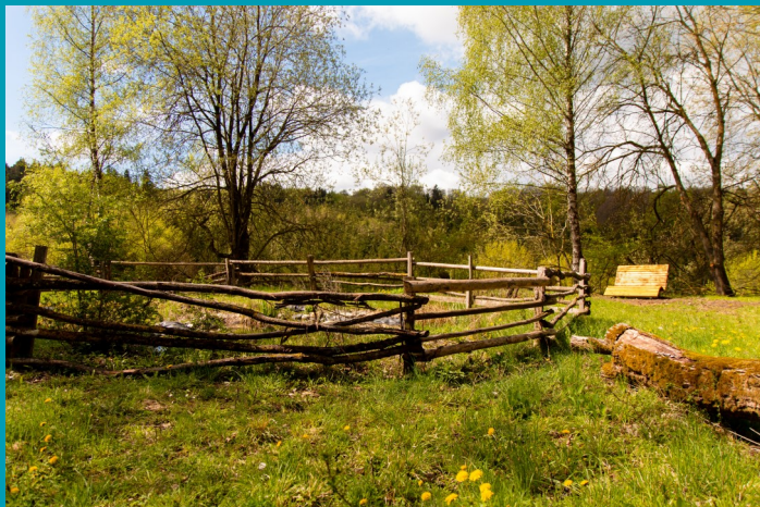
Biotop mit Liegebank