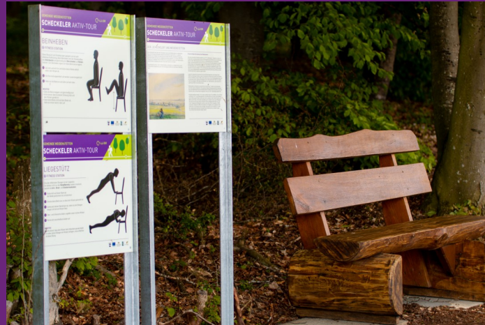
Fitness-Übungen am Scheckeler